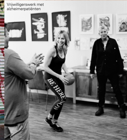
Vrijwilligerswerk met alzheimerpatiënten

‘In die tijd dachten we dat als heel Nederland af en toe xtc zou gebruiken, iedereen wat meer van elkaar zou houden’