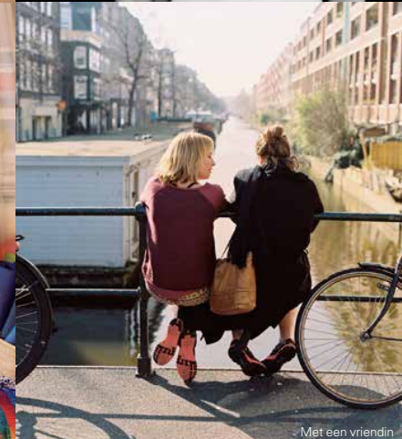
Met een vriendin