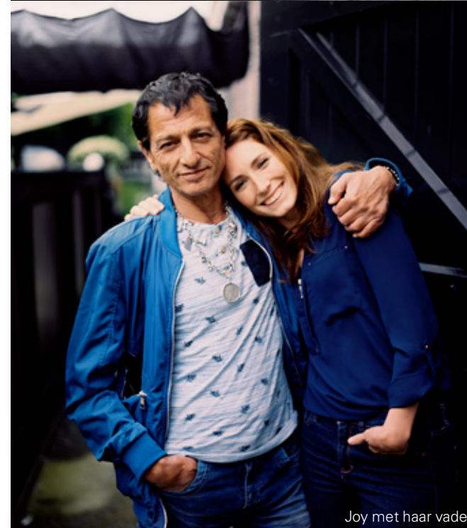
Joy met haar vader