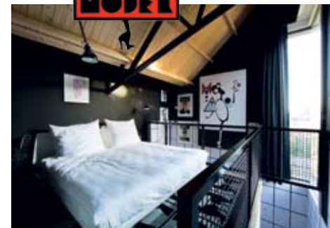
KAMER HOTEL MODEZ, INGERICHT DOOR PIET PARIS