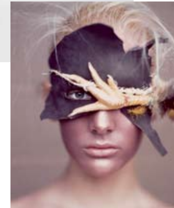
BEELDMERK MODE BIËNNALE ARNHEM