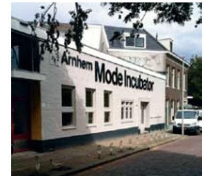
ARNHEM MODE INCUBATOR