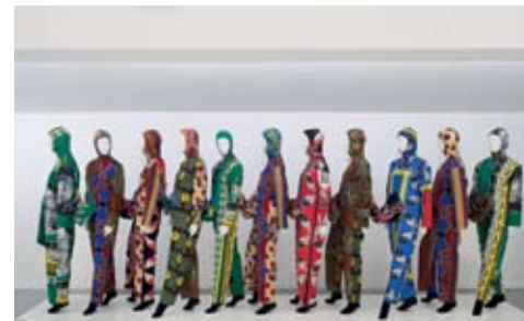
UIT DE VLISCO-TENTOONSTELLING SIX YARDS