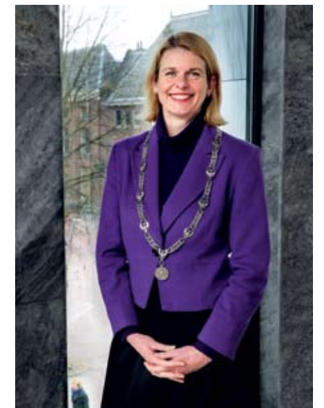
BURGEMEESTER PAULINE KRIKKE

nemerschap te overbruggen. 'Ontwerpers zitten er een aantal jaar, krijgen een atelier en zakelijke begeleiding. Dat is bijzonder, want juist die eerste schreden zijn erg lastig.' Er worden ook lezingen gegeven. 'We willen de kennis vergroten bij zowel ontwerpers als andere geïnteresseerden.'