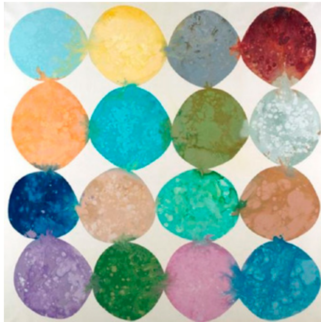
Geschatte prijs: $ 4,230 - $ 5,070 Origineel schilderij van Randy Hibberd invaluable.com

Let wel op de voorwaarden: soms mag je bijvoorbeeld niet in het weekend komen.'