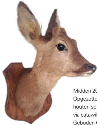
Midden 20e eeuw, Europa Opgezette hertenkop op een houten sokkel, in prachtige conditie, via catawiki.nl Geboden € 65