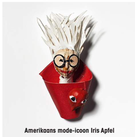
Amerikaans mode-icoon Iris Apfel