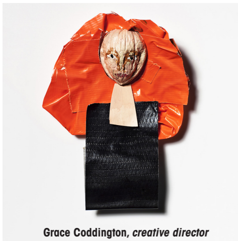
Grace Coddington, creative director van de Amerikaanse Vogue