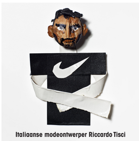
Italiaanse modeontwerper Riccardo Tisci