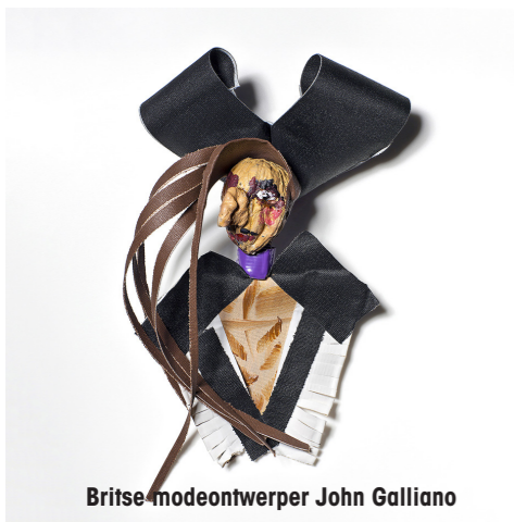
Britse modeontwerper John Galliano