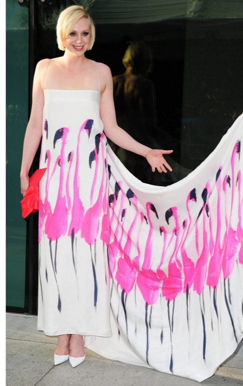
Britse actrice Gwendoline Christie in jurk van Giles Deacon met Robertsons flamingo's