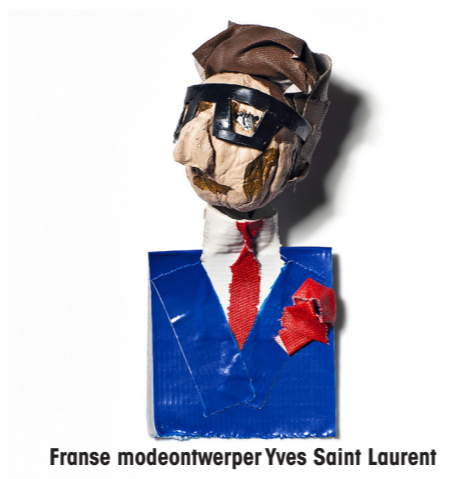
Franse modeontwerper Yves Saint Laurent