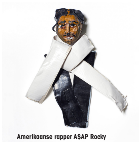
Amerikaanse rapper ASAP Rocky