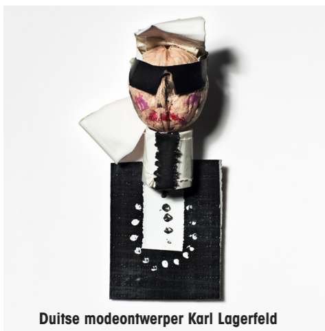
Duitse modeontwerper Karl Lagerfeld