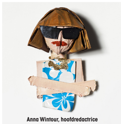
Anna Wintour, hoofdredactrice van de Amerikaanse Vogue