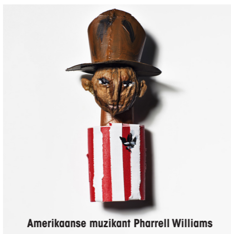
Amerikaanse muzikant Pharrell Williams