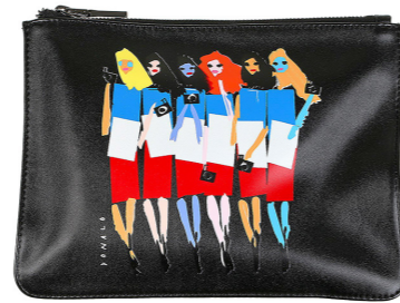
Tas, ontworpen voor winkel Colette