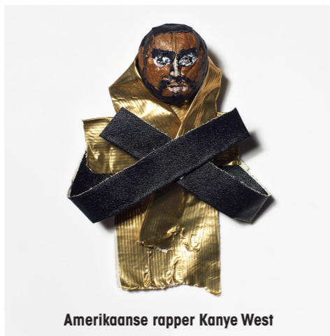
Amerikaanse rapper Kanye West