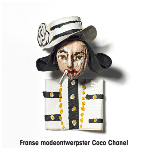
Franse modeontwerpster Coco Chanel