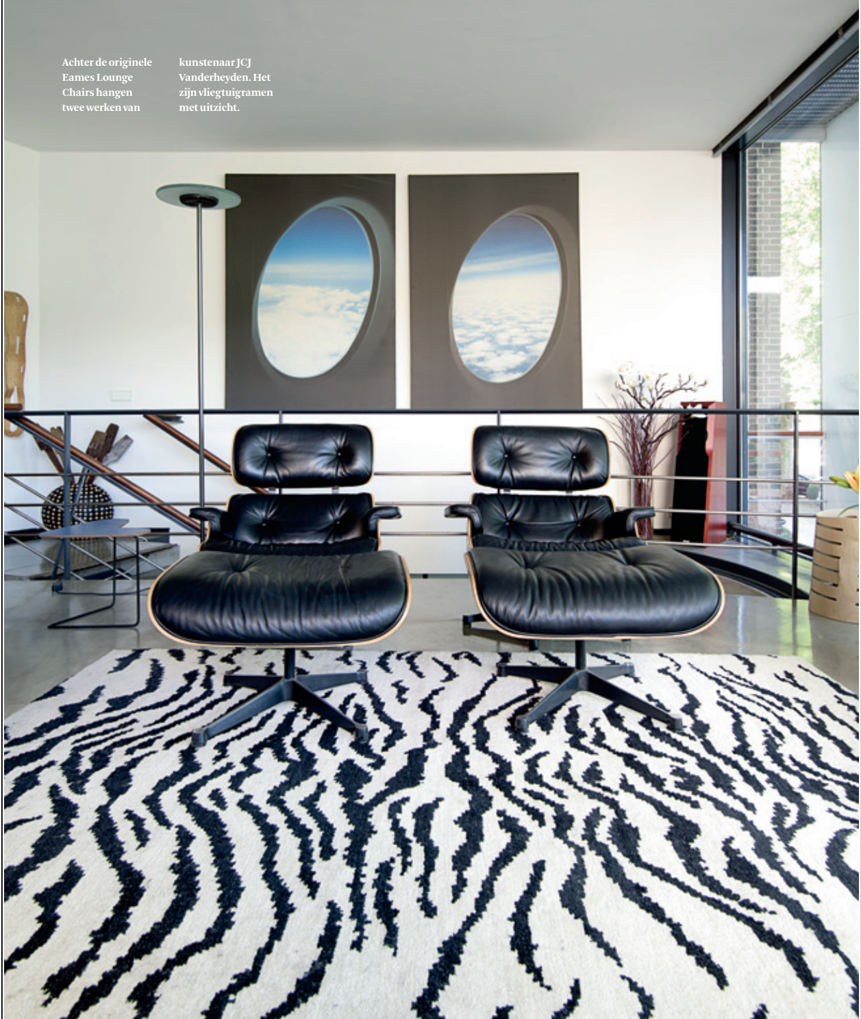
pagina 90, 19-09-2015