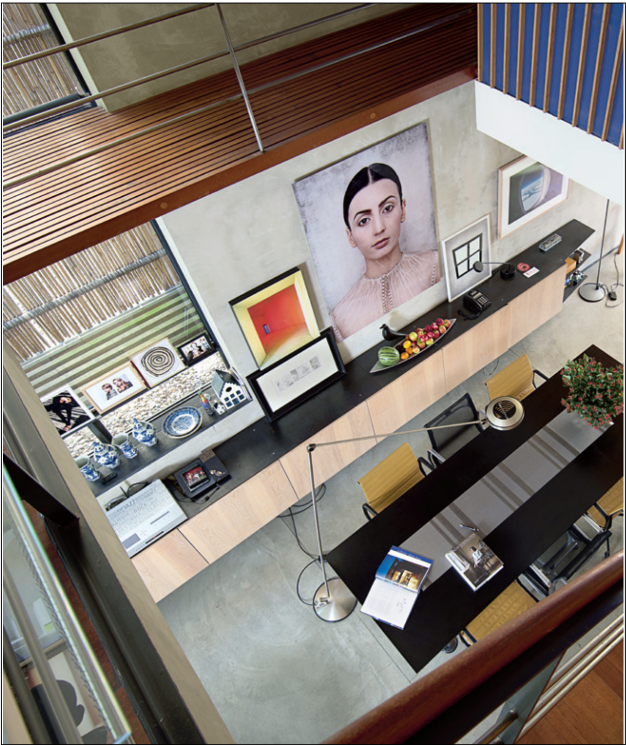
pagina 86, 19-09-2015