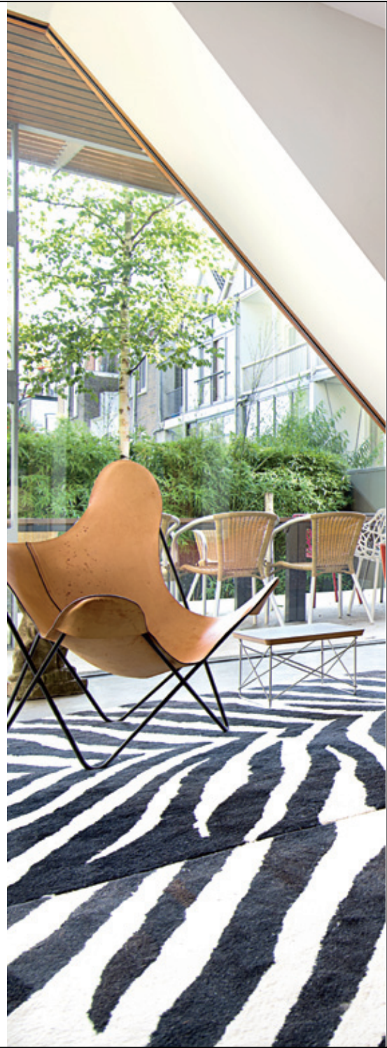
trappen. Onder: vanuit de werkkamer heeft Francine Houben uitzicht over de Kralingse Plas. De parketvloer bestaat uit afzelia- en wengehout, het kleed is van de Bijenkorf.