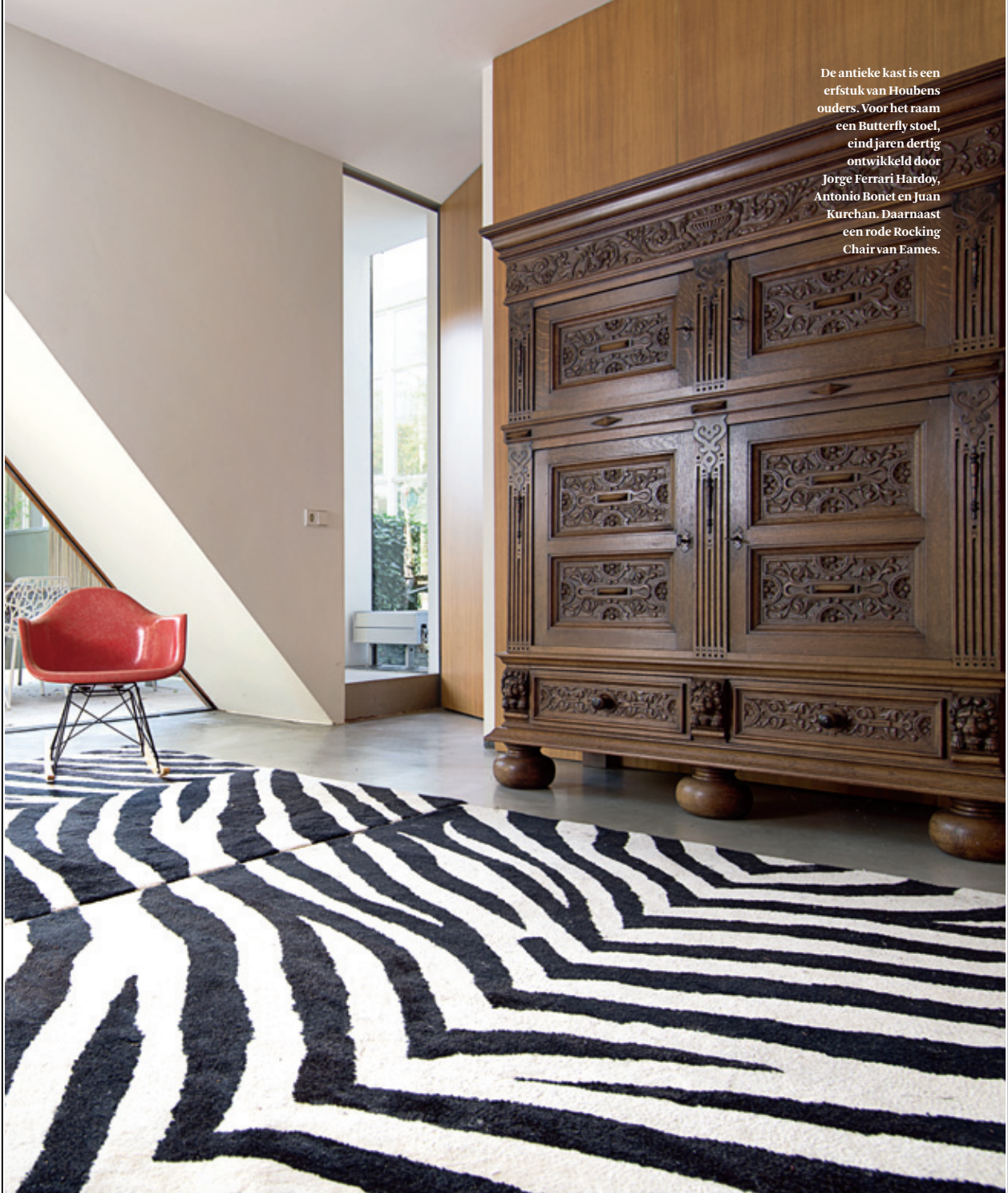
pagina 89, 19-09-2015