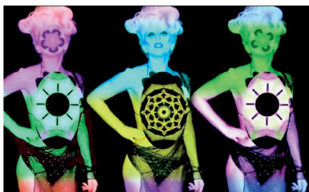
Lady Gaga

A l sinds de oprichting in 2000 trekt de website SHOWstudio.com bezoekers die werkzaam zijn in, of een grote affiniteit hebben met de mode. Maar SHOWstudio is voor veel meer mensen interessant. Op de aantrekkelijk vormgegeven website staat een veelzijdig aanbod van interviews met ontwerpers, journalisten en andere modeprofessionals. Ook zijn er reportages van modeshows, fotoshoots en modedfilms te bekijken en is er een webshop met kunstwerken en mode-items. SHOWstudio werkt samen met een keur aan creatievelingen: jonge modeontwerpers als Gareth Pugh, en bijvoorbeeld ook de gevestigde Vivienne Westwood, hoedenmaker Stephen Jones, model Kate Moss en popster Lady Gaga. Oprichter van SHOWstudio is Nick Knight (55), die meer dan twintig jaar ervaring heeft als modefotograaf, en ook muziekvideo's voor Björk en Kanye West regisseerde. In een filmpje op de site deelt Knight zijn ideeën over de populaire fashion -films. Vaak houden de filmpjes het midden tussen een magische videoclip en een artistieke commercial. 'Een modeontwerper creëert altijd met het idee dat de kleren in beweging worden gezien.' SHOWstudio maakt dankbaar gebruik van het interactieve karakter van internet: iedereen kan reageren en bijdragen, en de website is 'gebaseerd op het idee dat het laten zien van het hele creatieve proces – van ontwerp tot realisatie – gunstig is voor de kunstenaar, het publiek en de kunst zelf,' aldus Knight. Daarom zijn er ook 'achter de schermen' van films